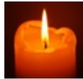
YOGA SILVESTER - NEUJAHR RETREAT